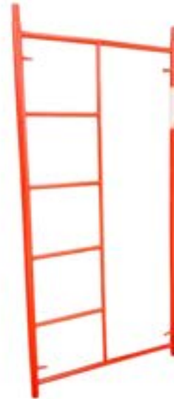
ZM MARCO TRADICIONAL 2.00 x 1.00