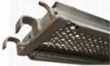
ZM TABLÓN ACERO