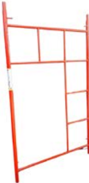
ZM MARCO TRADICIONAL 2.00 x 1.25