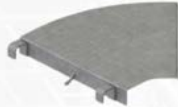
ZM PLATAFORMA LIGACIÓN ANGULAR 45°