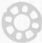
ZM ROSETA 2 1/2