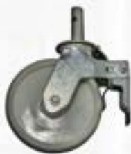
ZM RUEDAS DE NYLON 8"