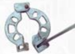
ZM ROSETA MOVÍL