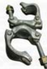
ZM ABRAZADERAS GIRATORIA